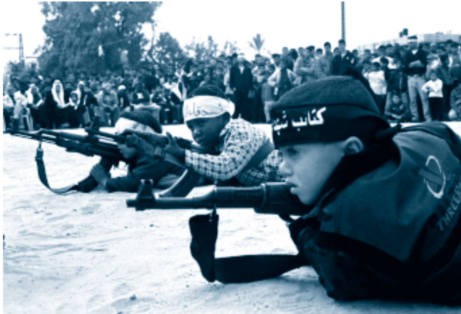
Palästinensische Jungen üben den Gebrauch von Schusswaffen am 25.2.2002 in einem Camp in Rafah im Gaza-Streifen, das von Mitgliedern der „Al Aksa Brigaden“ geleitet wird.