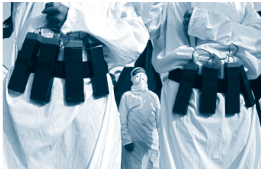
Sprengstoff-Gürtel tragen diese maskierten Mitglieder der extremistischen Organisation Islamischer Jihad (Heiliger Krieg) und potentiellen Selbstmordattentäter bei einer Kundgebung am 23.4.2002 in Gaza.

ne Terroristen, die am 28. September 1981 in Kairo den damaligen ägyptischen Staatspräsidenten Sadat ermordeten. Gegenwärtig verbüßt Rahman in den USA eine Haftstrafe wegen des ersten Anschlages auf das World Trade Center im Jahr 1993. Die Jihad-Bewegung geht mit gewalttätigen Aktionen gegen Muslime vor, die ihrer Auffassung nach den Islam