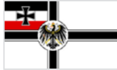
1892 bis 1903