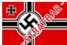
1938 bis 1945

Alle bis auf die letzten beiden sind nicht strafbar.