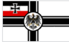
1903 bis 1921