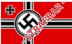
1935 bis 1937